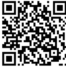
QR2: De Tú a Tú. Lasso [Canción]

este término no tiene cabida. Se trata de comunicación de tú a tú, y la educación basada en este tipo de comunicación es educación de igual a igual.